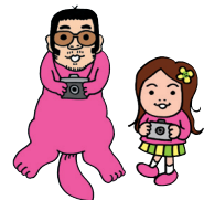
カメラッコ&カメラ嬢 ©リリー・フランキー

古本市、ワークショップ、映画上映などイベント詳細は http://honokuri.exblog.jp/